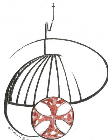
150° Anniversario Dedicazione Chiesa Parrocchiale San Paolo 1870-2020